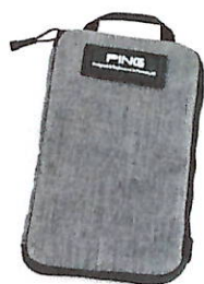
4 Valuable Pouch