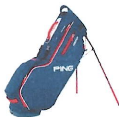
2 sacs Hooper Lite