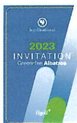
2 Green-fees Albatros / Golf National

En cas de tirage au sort, le Club devra adopter un règlement du tirage au sort conforme (modèle disponible sur demande auprès de la FFGolf). Les participants au tirage au sort devront être informés et avoir à disposition le règlement.